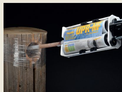
600 mL reparasjonsmasse