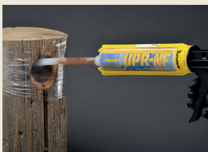
250 mL reparasjonsmasse