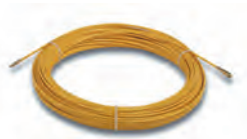
1652855 till 1652961