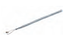
1659021 till 1659027