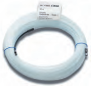
1659002 till 1659007