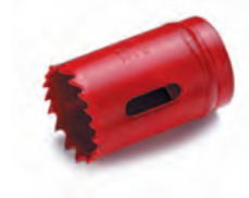
1625727 till 1625716, används till liten "spindel" på dessa nr.