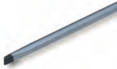
1661627 till 1661632