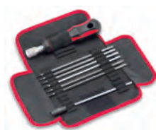
1661266 och 1661267