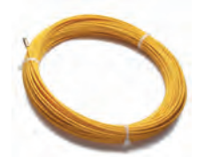
1652825 till 1652827