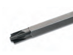
1661260 - 1661261 Bits SPEC PZ/FL 70mm