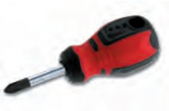
1661618 / 1661619