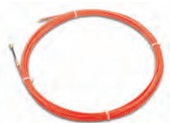
1652978 till 1652982