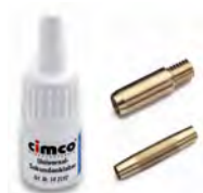
1652964 / 1652965