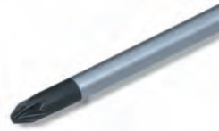
1661637 till 1661640