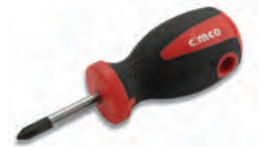
1661616 / 1661617