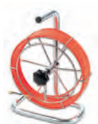
1652983 till 1652986